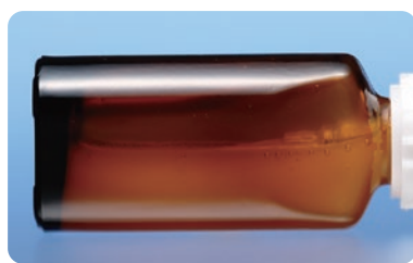
よく振った後の薬液の状態