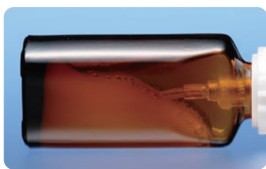
2日間放置後の薬液の状態